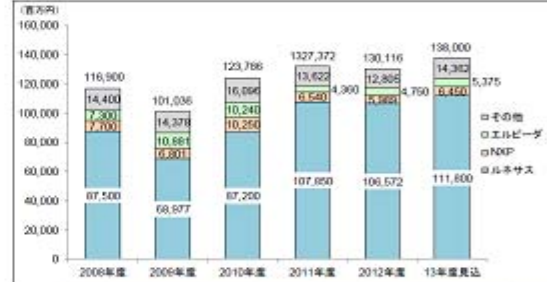
図 21. リョーサンの製品ベンダー別半導体売上高推移